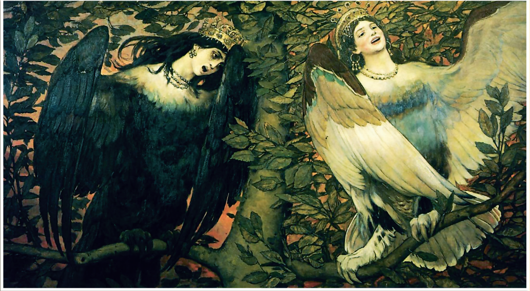
В. Васнецов «Сирин и Алконост. Песнь радости и печали», 1896.

в русской истории. Выбрано несколько ключевых эпизодов из их жизни, показана крупница уникального внутреннего мира героев.