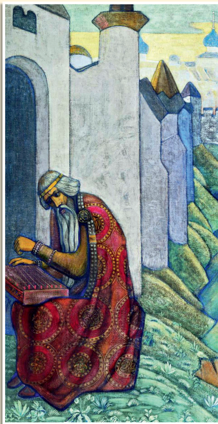
Н. Перих «Баян», 1910.

И задумал мудрый Род сотворить чудный мир, где бы нашлось место и жизни, и смерти, и белому дню, и чёрной ночи, и жаре самой жаркой, и холоду самому