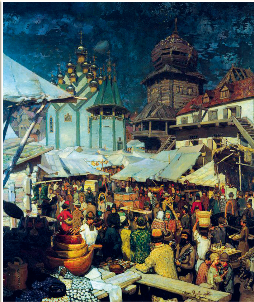
А. Васнецов «Базар. XVII век», 1903.