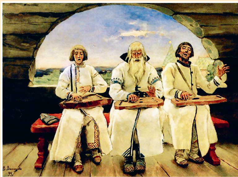
В. Васнецов «Гусляры», 1899.

Есть мнение, что гусли начались с обыкновенного охотничьего лука, где тетива сильно натянута и при прикосновении издаёт приятный мелодичный звук. Именно эту тетиву в старину называли «гусла».