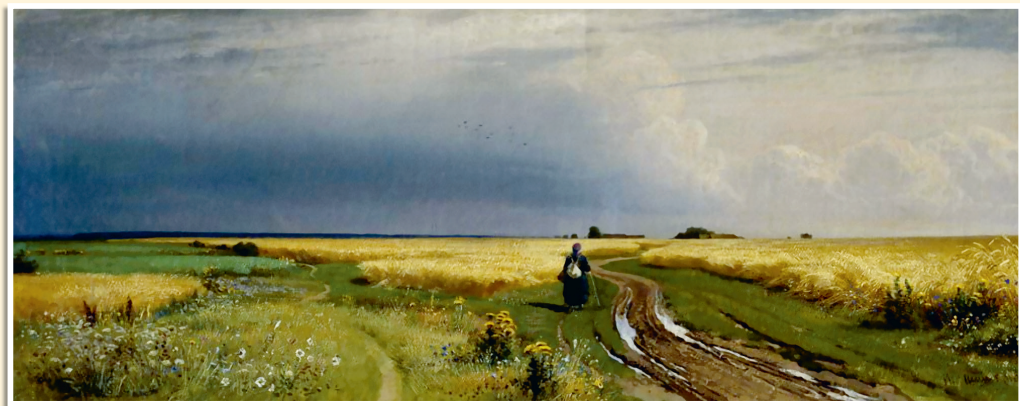
И. Шишкин «Дорога во ржи», 1866.

Чужаки тот камень видели, подходили к нему вокруг и даже крушить со всей силой вражьей пытались — ни пламенной искры, ни крошки в руки нечестные не упало, в карманы или за пояса не сложено. Если и падали крохи — то в море далёкое синее. А из моря светом лазоревым исходили, волной живой берега Руси омывали.