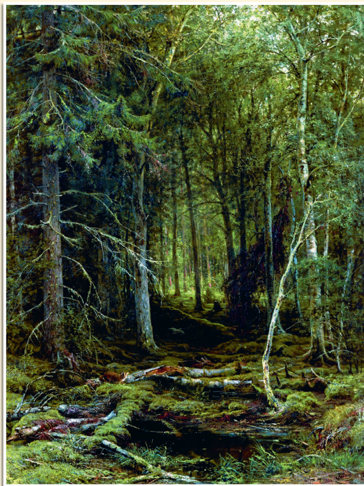
И. Шишкин «Лесная глушь», 1872.

О тцветает со звоном алый жар-цвет на солнечных лесных опушках, в тёмных лесных чащах жизнь будто засыпает волшебным сном. Тяжело склоняются ракиты ветвистые над реками, бегущими к морям дальним, а берега расступаются, не в силах противостоять силе воды.