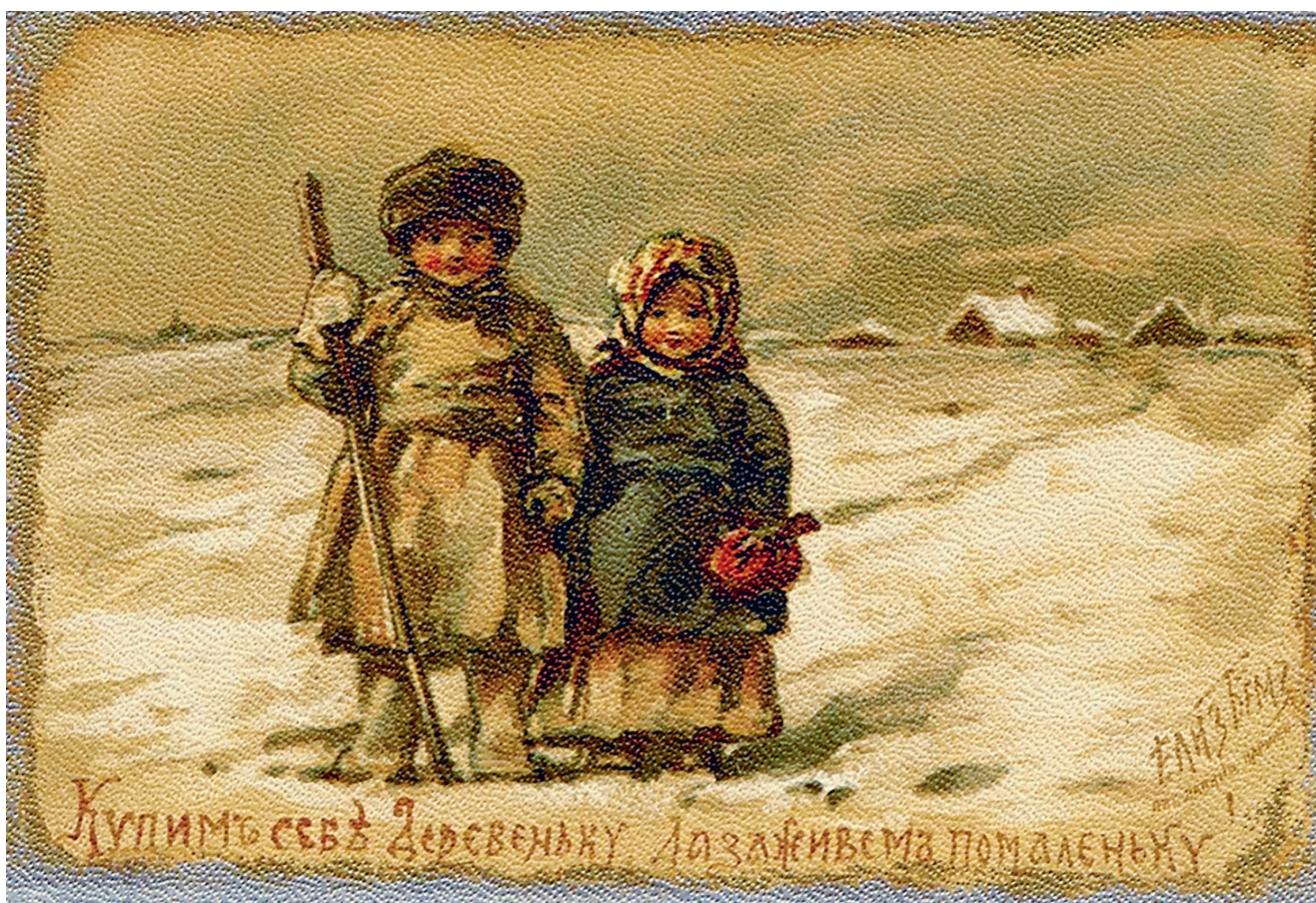
Е. Бём. Зимняя открытка. Конец XIX — начало XX в.