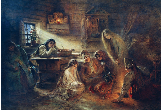
К. Маковский «Святочные гадания», 1890.