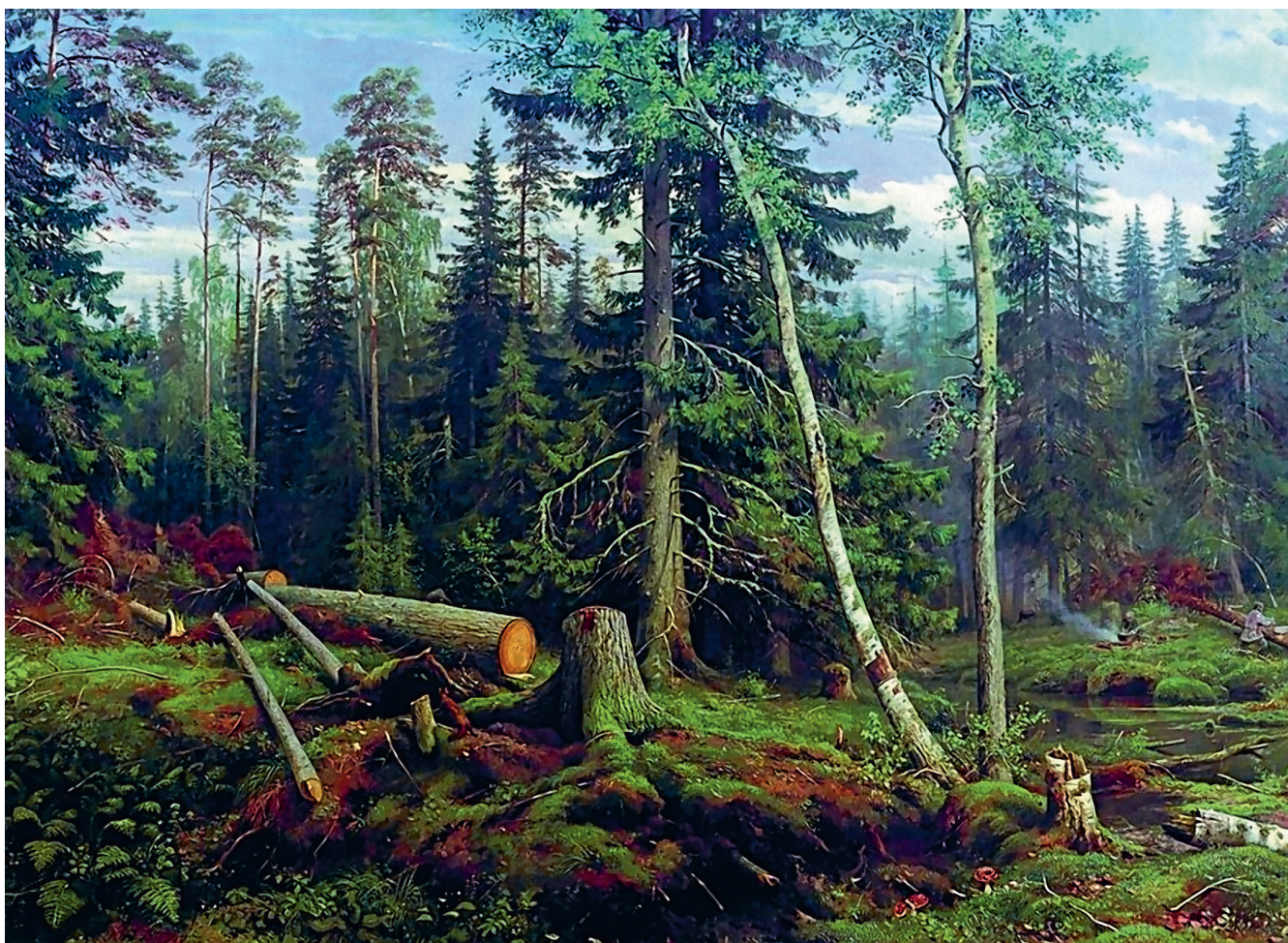
И. Шишкин «Рубка леса», 1867.

Из века в век передавали деды науку, что в толщине дерево для дома должно быть до 10 вершков — для нижней части дома и до 8 вершков — для верхней.