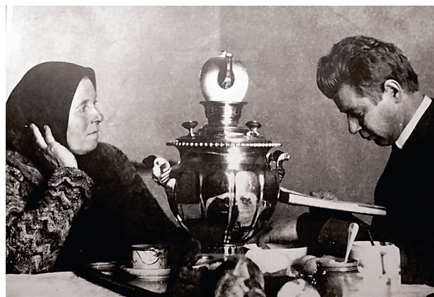
Сергей Есенин читает стихи своей матери. Фотография, 1925.

Если крикнет рать святая: «Кинь ты Русь, живи в раю!» Я скажу: «Не надо рая, Дайте родину мою».