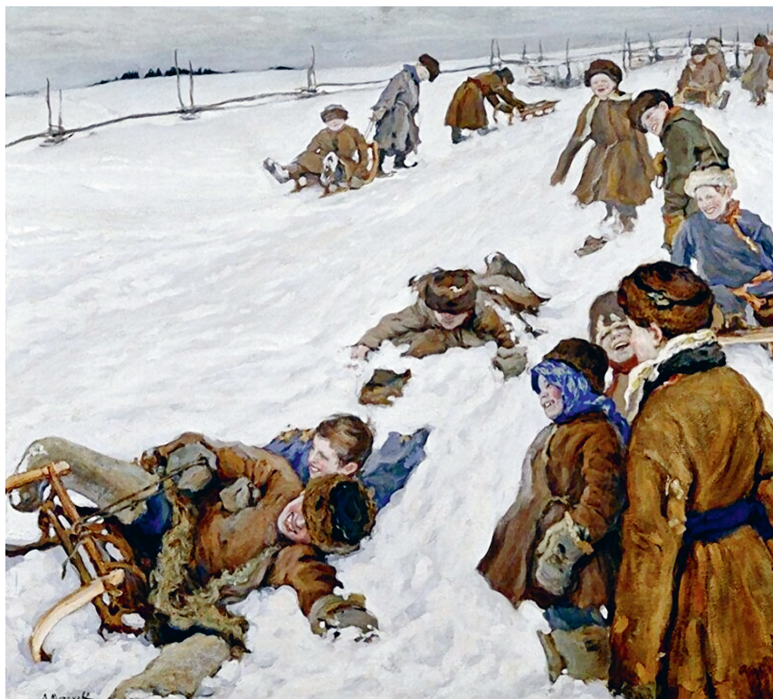
А. Моравов «Зимний спорт», 1913.

Дорогой маленький друг! Ты знаешь, что в русском языке во многих словах есть суффиксы . Они очень важны, ведь с их помощью создаются новые слова с разными смысловыми оттенками.