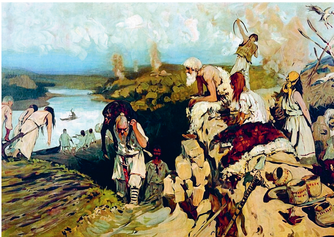
С. Иванов «Жильё восточных славян», 1907.

☞ Хозяюшка будущего дома накануне выбора места пекла хлеб «на новую избу». Если он был не пышный, а кривой, горелый, с трещинами, то это означало, что изба на выбранном месте не будет счастливой.