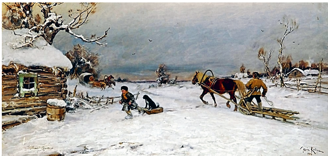
Ю. Клевер «Зима!.. Крестьянин, торжествуя...», 1919.