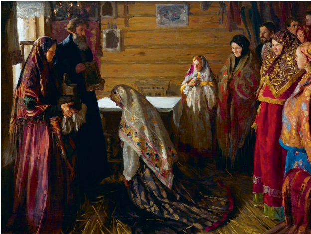
И. Куликов «Старинный обряд благословения невесты в г. Муроме», 1909.