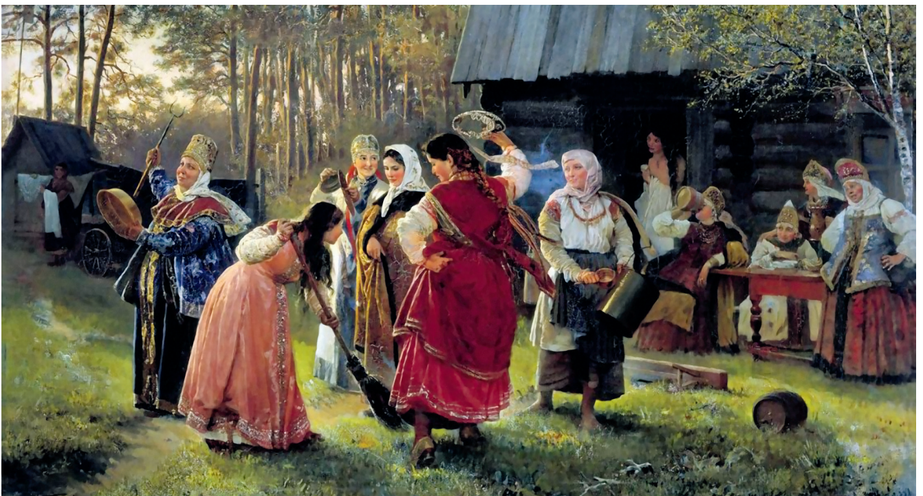
А. Корзухин «Девичник», 1889.

Обрядом называют совокупность действий установленных обычаем. Такое название у этих действий возникло, скорее всего, потому, что для каждого обряда надевали особую одежду — наряд , то есть, как говорили раньше, обряжались . Для свадьбы это яркие, красивые, дорогие наряды у жениха и невесты. Многие обряды, связанные с земледелием, проводили в чистой белой одежде. На летние праздники украшали яркую одежду зеленью, на голову надевали венок из цветов, травы, веток.