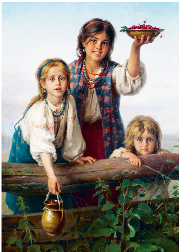
Х. Платонов «Купите ягод!», 1888.

Добро пожаловать в удивительный, красивый и очень интересный мир русской избы!