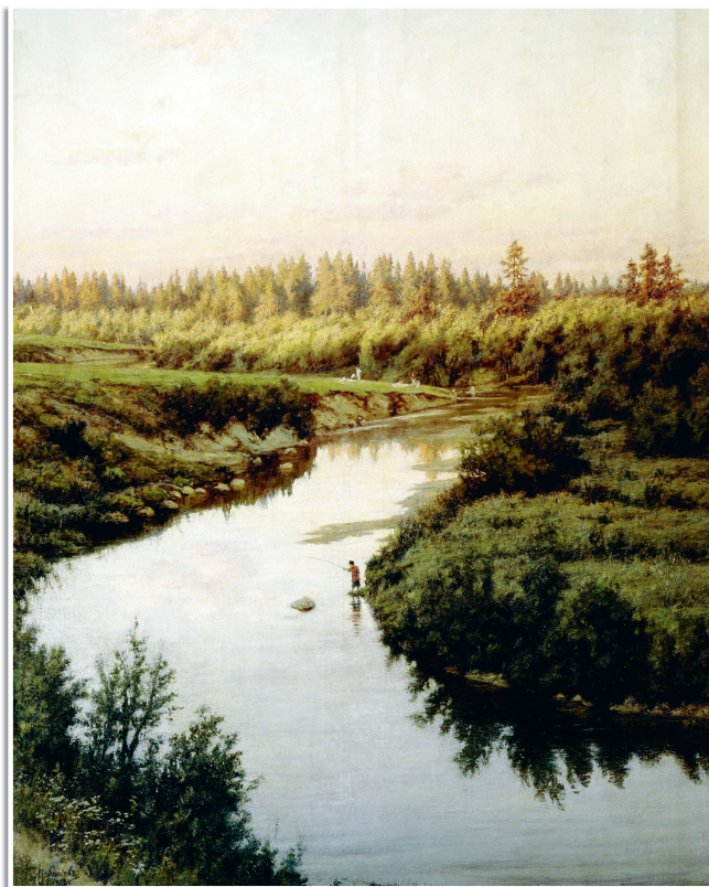
П. Брюллов «Пейзаж с рекой», 1900.

В старину наши люди всегда были уверены, что вода — это граница. Иногда между очень и очень разными мирами: добрым и злым, светлым и тёмным, праведным и лживым, живым и мёртвым.