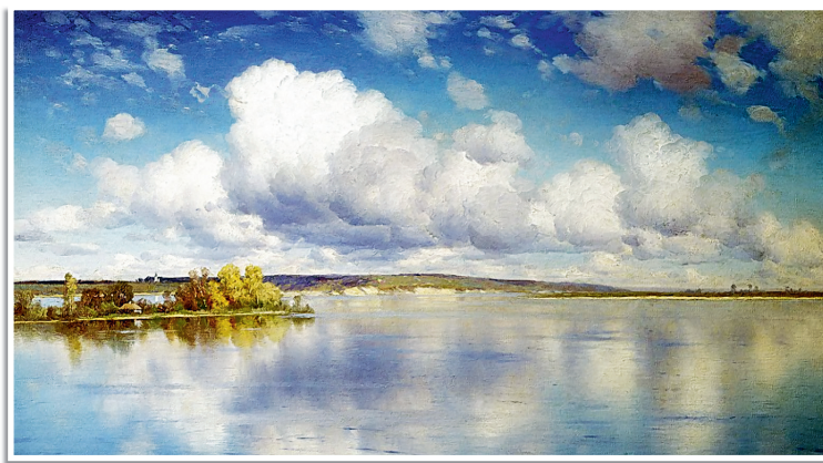
К. Крыжицкий «Озеро», 1896.