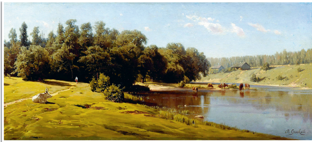
В. Орловский «Полдень», 1880.