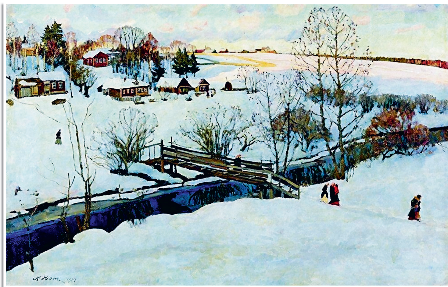
К. Юон «Зима. Мостик. Лигачёво», 1914.

Зимой у проруби девушки высматривали во время Святков 1 судьбинушку свою. Как тронет первый ледок водицу, так и застынет на нём рисунок — вот и рассматривает его девица: что увидит, то и сбудется. Мало того: верили, что воды святочной надо в дом принести да опустить в неё горсточку зерна: каким рисунком оно сложится — то и ждать надо.