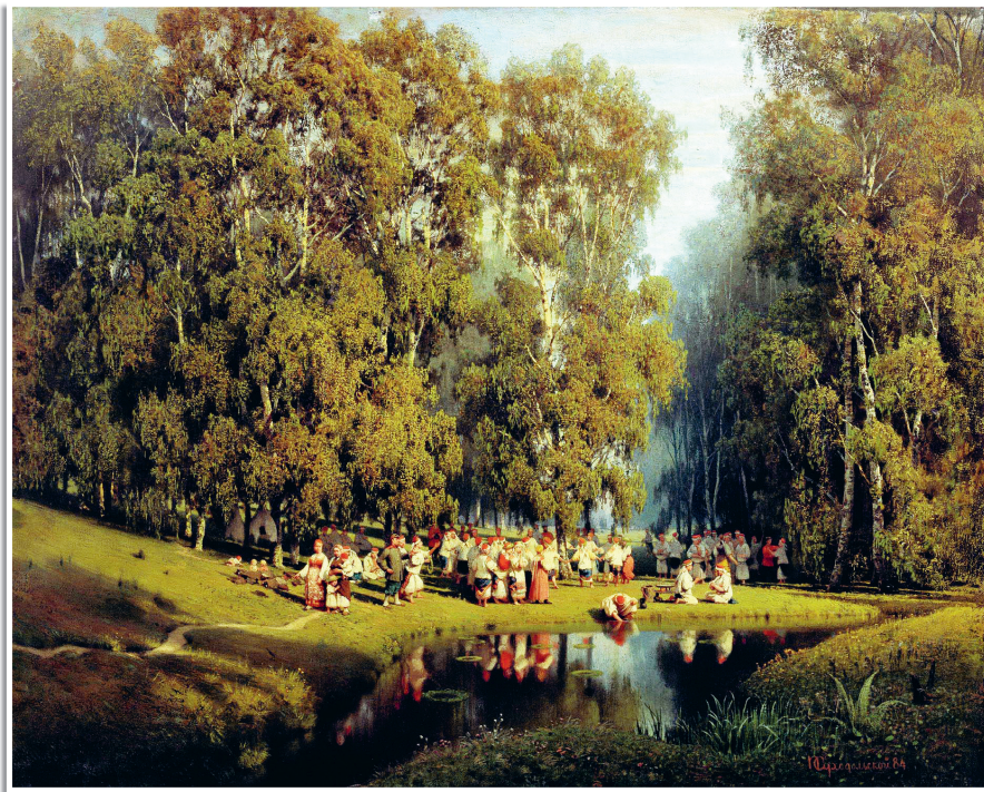
И. Суходольский «Троицын день», 1884.

«Орёл бросился на сине море, схватил и вытащил бочку на берег, сокол полетел за живой водою, а ворон за мёртвою. Слетелись все трое в одно место, разбили бочку, вынули куски Ивана-царевича, перемыли и складили как надобно.