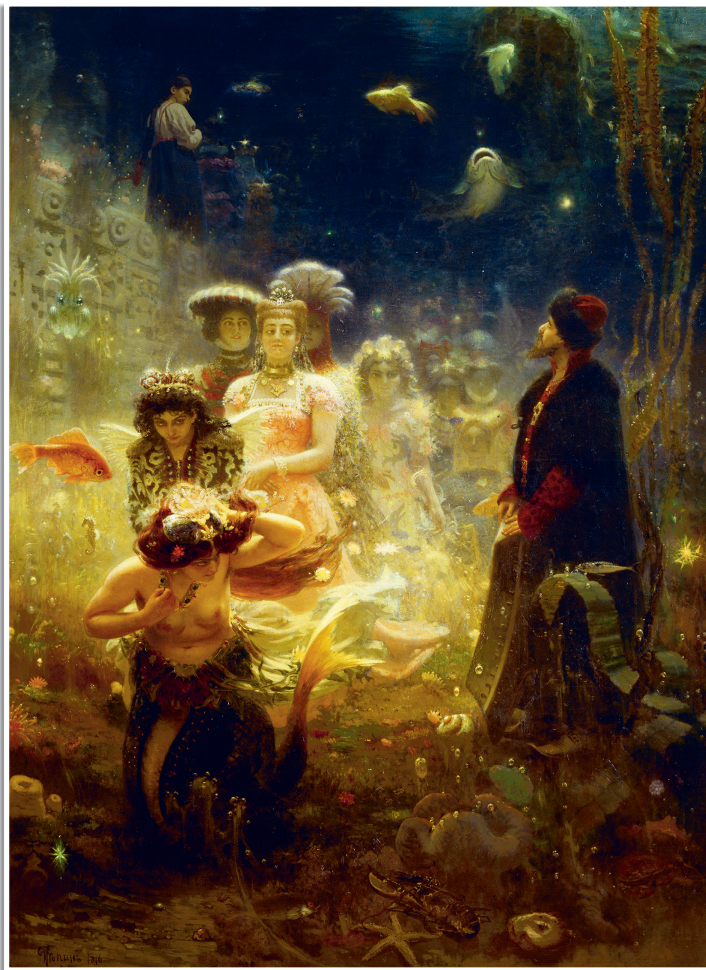
И. Репин «Садко», 1876.

Но попасть в другой мир — значит в этот, любимый, светлый, чистый, добрый, праведный, не вернуться. Сгинуть, пропасть, исчезнуть. Вот и рождались сказки с мечтой о том, что вернуться всё-таки можно, но для этого нужно преодолеть самые сложные испытания. Например, Садко 1 , купец из Нижнего Новгорода, чтобы выбраться со дна океана, где будто бы гостил у Владыки морского, по совету его племянника — Вояного, женился на красавице Чернаве-реке, а уж та его спасла, вернула на землю.